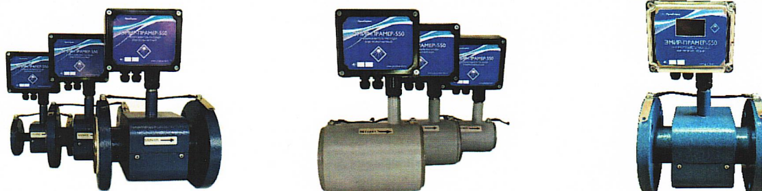
Преобразователи с ЭП в пластиковом корпусе Исполнение фланцевое