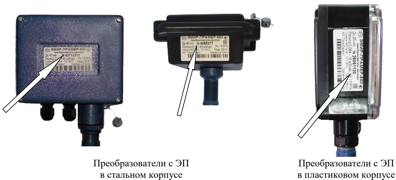
Преобразователи с ЭП в стальном корпусе