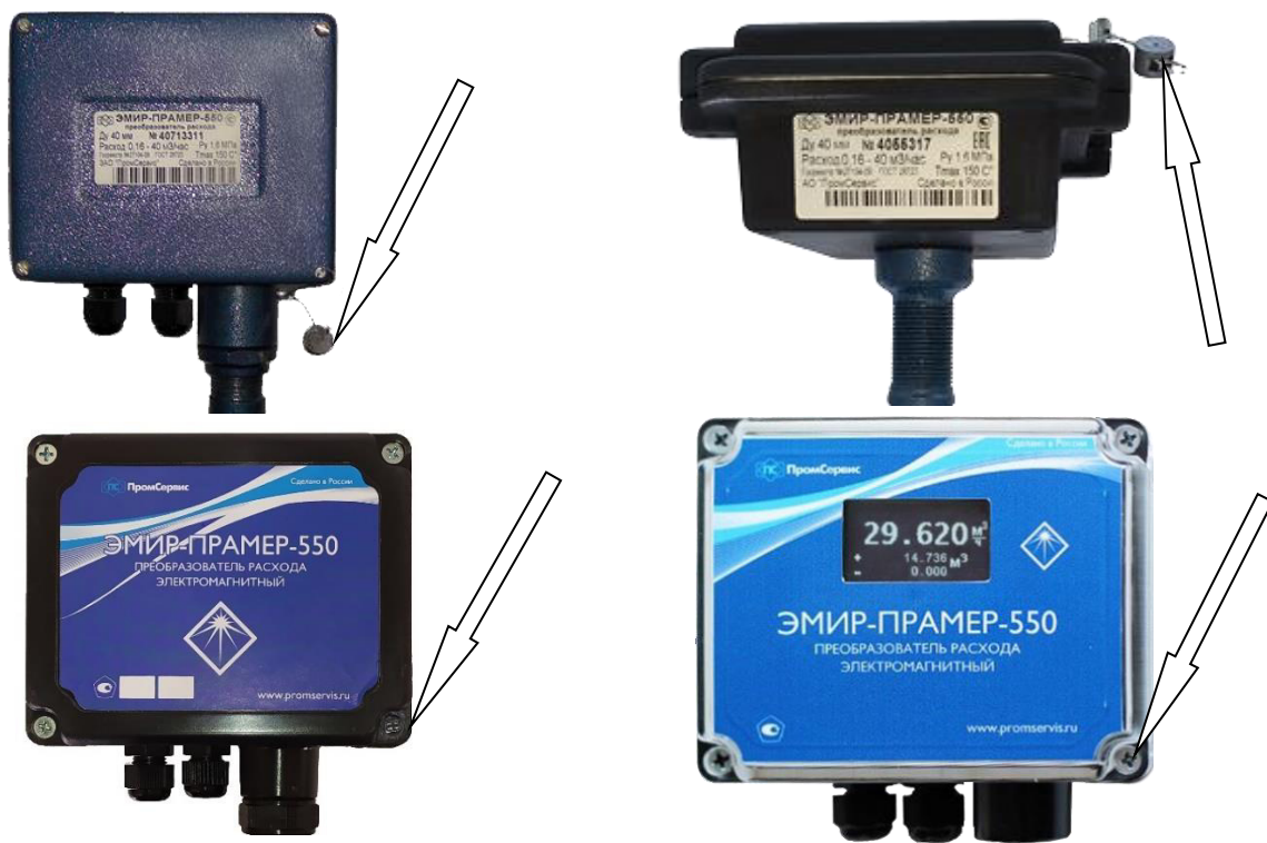
Рисунок 2 – Схема пломбировки от несанкционированного доступа, обозначение места нанесения знака поверки преобразователей

Заводские номера преобразователей указываются в цифровом формате на маркировочной табличке (шильдике), расположенной на лицевой поверхности в стальном корпусе ЭП или на боковой поверхности в пластиковом корпусе ЭП и представлены на рисунке 3.